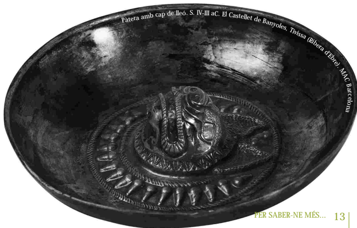
Pàtera amb cap de lleó. S. IV-III aC. El Castellet de Banyoles, Tivissa (Ribera d'Ebre). MAC Barcelona